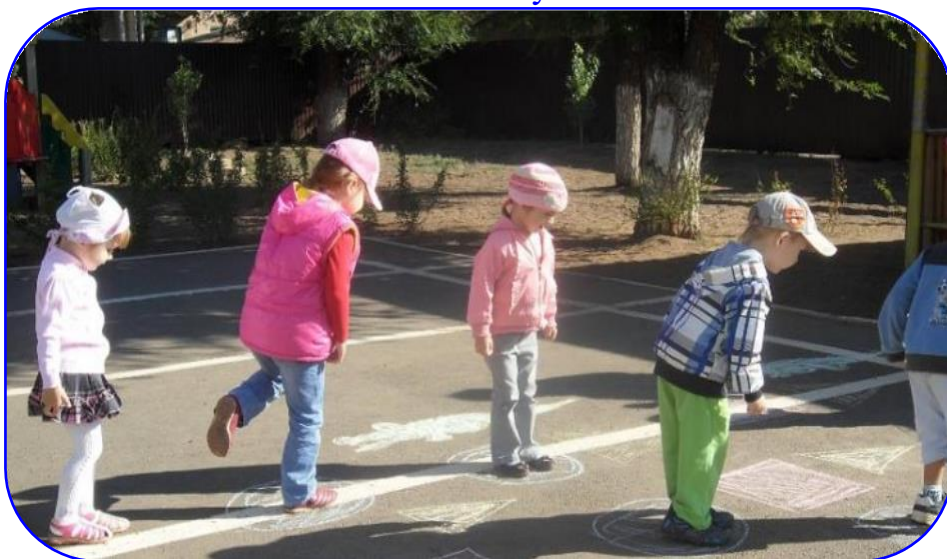
для самостоятельной деятельности